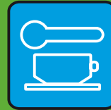
mangiare & bere insieme