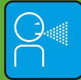
tossire & starnutire