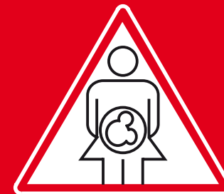
mamma verso figlio (parto, allattamento)