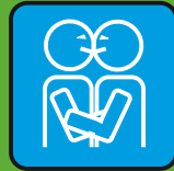
baci & abbracci