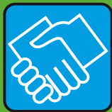
stringere le mani

NESSUN RISCHIO · NESSUN PROBLEMA · NESSUN RISCHIO · NESSUN PROBLEMA