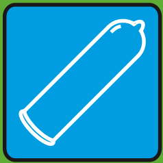
secco con profilattico